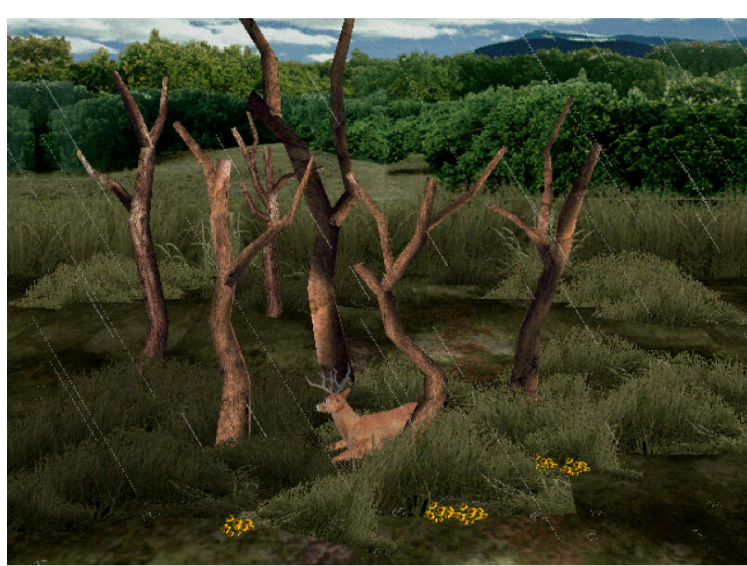
« Landscape Deer » (2023), de Robbie Barrat. ROBBIE BARRAT

A la foire Paris Photo, le grand rendez-vous mondial de l'image fixe qui se tient au Grand Palais éphémère jusqu'au dimanche 12 novembre, sur le stand de la galerie Jean-Kenta Gauthier, surprise. On n'y trouve aucune image, rien que des mots, en anglais. Ils ont été inscrits sur les murs par l'artiste américain David Horvitz, comme des haïkus. « Des cailloux jetés dans le coucher de soleil », « L'ombre de Ela, âgée de quelques jours . » Ou juste : « De l'argent . » Ce sont les descriptions d'images numériques personnelles et banales que l'artiste a piochées dans ses archives et qu'il a décidé d'effacer définitivement. Une façon poétique d'évoquer le déferlement d'images qui caractérise notre époque, notre manie de vivre chaque instant à travers la photographie.