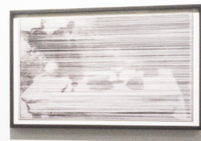
Niépce: L'Origine du monde Daniel Blaufuks, Raphaël Dallaporta, Daido Moriyama, Hanako Murakami 3 novembre 2021 - 5 février 2022 Vue d'installation (détail), Jean-Kenta Gauthier / Odéon, Paris